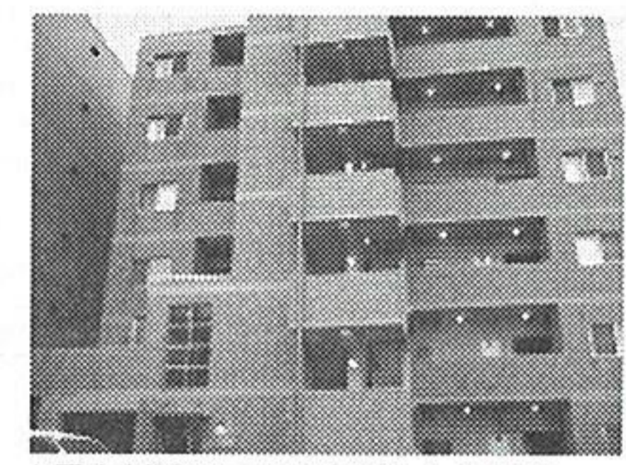
▲電力削減システムを導入した物件

料金体系の契約を結んでいるという。この契約のブレーカーを新たに設置する主開閉器契約(ブレーカー契約)という契約に切り替えることで基本料金が大幅に下がる。同社によると平均して約40%のコスト削減が可能だという。