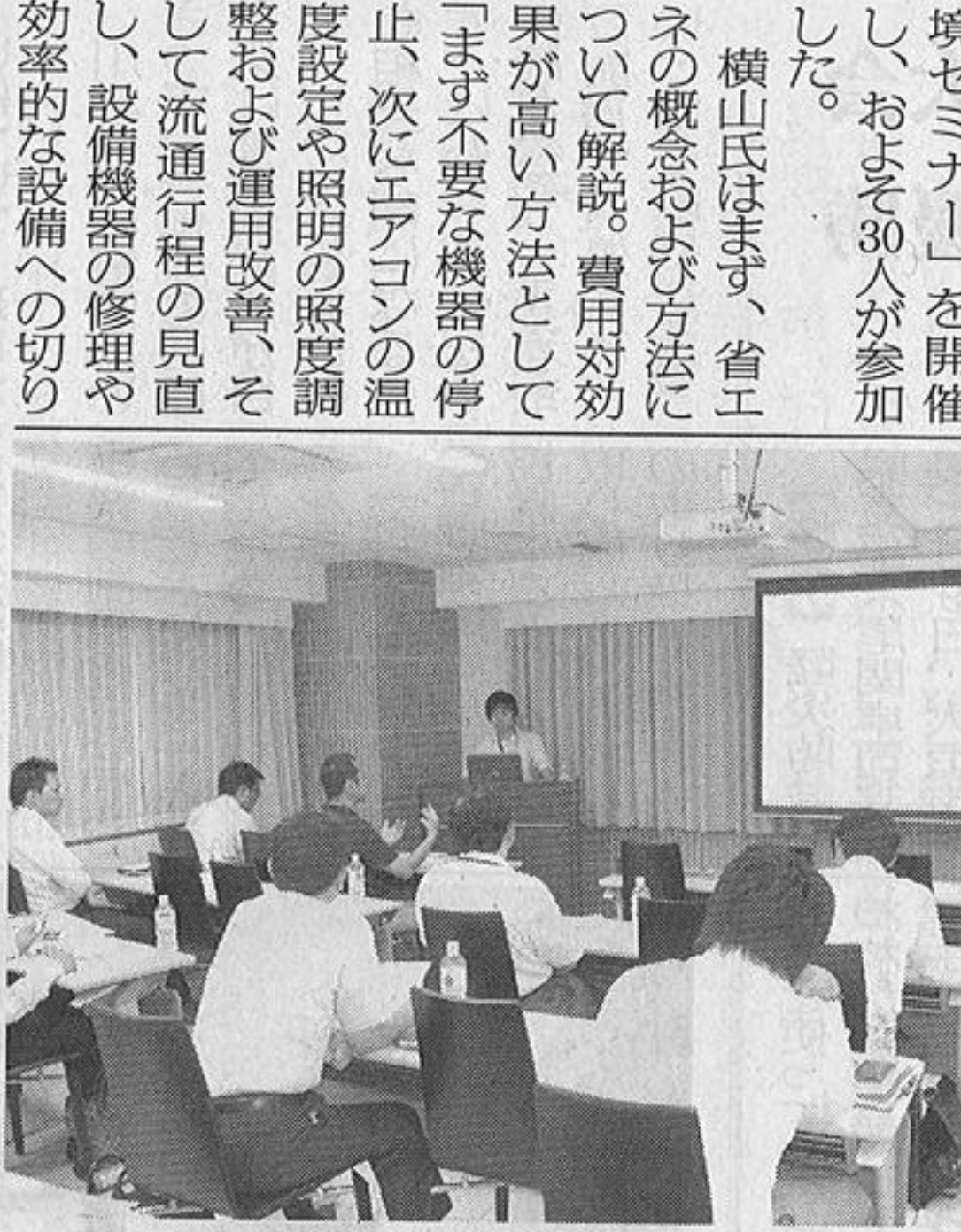
30人の参加者が熱心に聴講

内排出権市場の創設などによる企業に対する取り組みの強化など、大きな動きが起ることが予想される」とし、環境を前面に押し出したCSRによる企業価値の向上が重要と訴えた。 最後に「環境分野に取組んでいない企業は、選んでももらえない時代となる。価格とは別の付加価値として取り組んでほしい」と述べた。同セミナーは毎月1回程度開催していく予定。（加藤 崇）